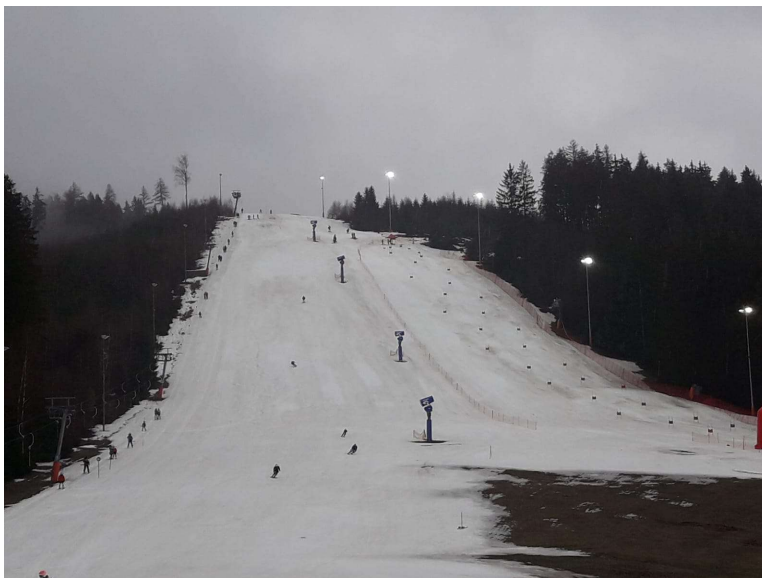
Rennstrecke „Streugrün“ in Schöneck

Während es in Erlbach erst am Nachmittag zur Siegerehrung zu regnen begonnen hatte, zeigte sich das Wetter am Sonntag in Schöneck von einer noch weniger guten Seite. Bereits am Morgen beim Einfahren und zur Besichtigung des Kurses regnete es zum Teil heftig. Aufgrund der Wetter- und Pistenbedingungen musste der Wettbewerb als Superslalom auf verkürzter Strecke durchgeführt werden. Schade, das hätte das Saisonfinale zwar anders verdient gehabt, aber an den Wetterverhältnissen lässt sich bekanntlich nicht herumschrauben. Mit Weitsicht und Professionalität waren von den Organisatoren bereits früh zwei verschiedene Kurse für die beiden Durchgänge gesteckt, so dass das Rennen ohne große Pausen in etwa 1,5 Stunden abgehakt war.